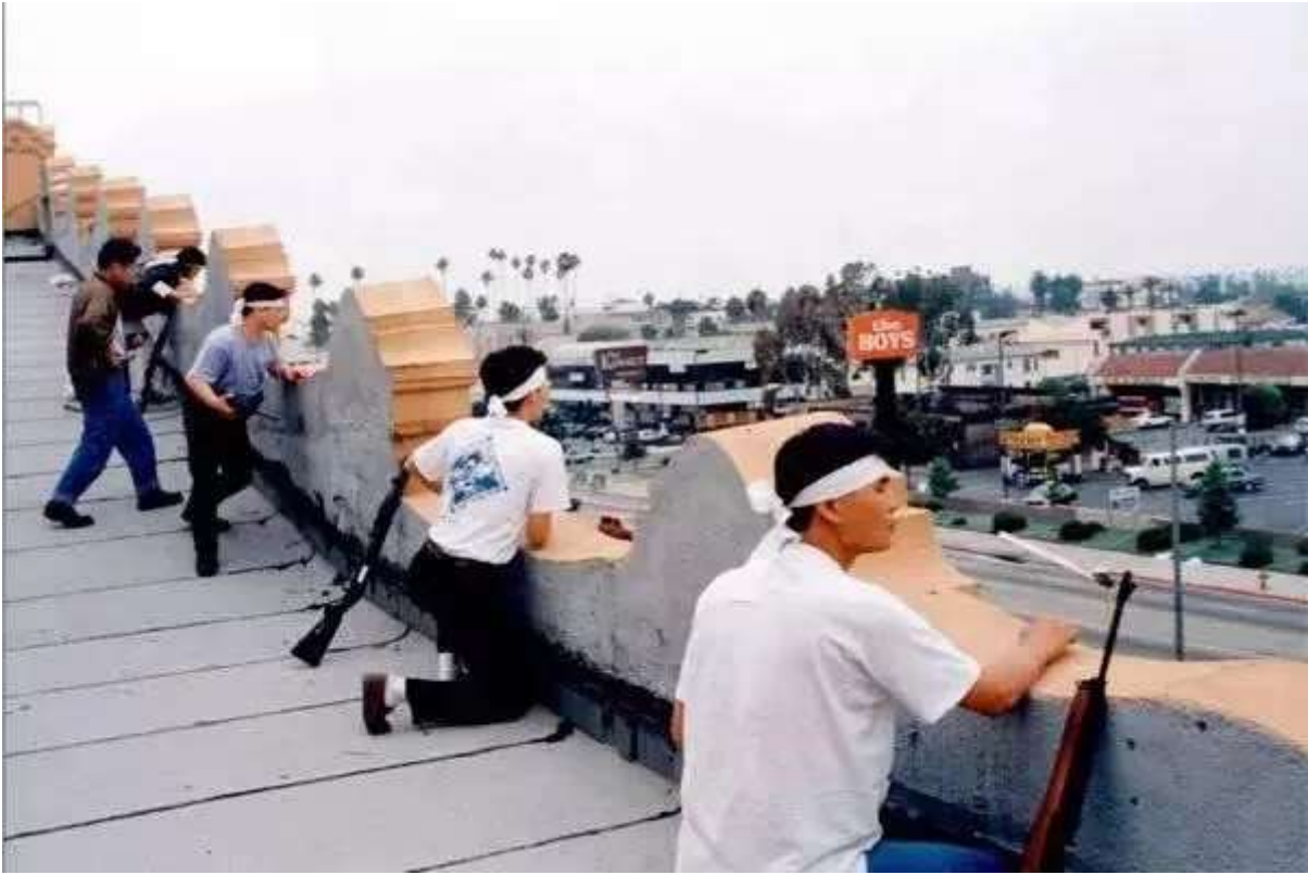
1992年韩裔社团拿起枪支对抗黑人针对韩国城的暴乱，我们华人社区是否也做好了这样的准备？